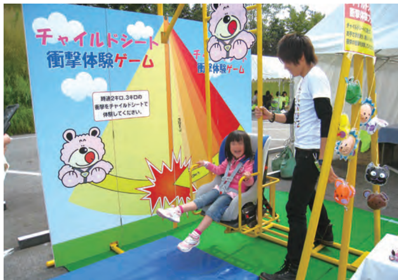
※外形寸法:長さ280×幅195×高さ210cm