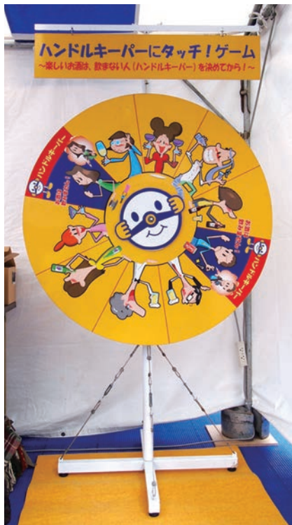
※外形寸法：幅90cm×高さ192cm×奥行き75cm

吸盤付きのボールを投げて、ハンドルキーパーにタッチ。ハンドルキーパー運動をわかりやすく楽しく紹介します。